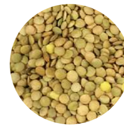
LINZEN (bruine, groene, blonde...)