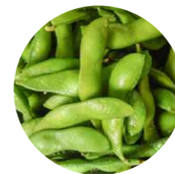
EDAMAME (onrijpe sojabonen)